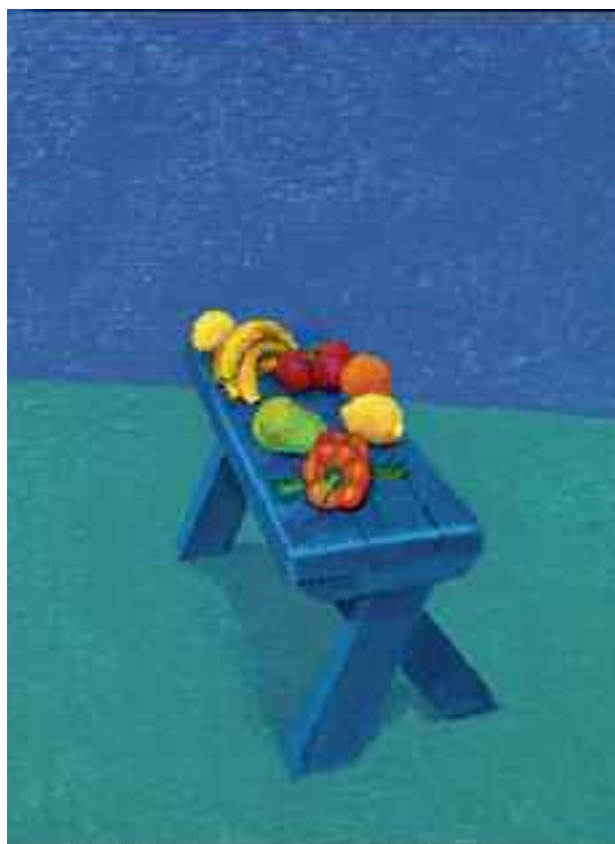
Fruit on a Bench 6th, 7th, 8th March 2014 Acrylic on canvas, 121.9 x 91.4 cm