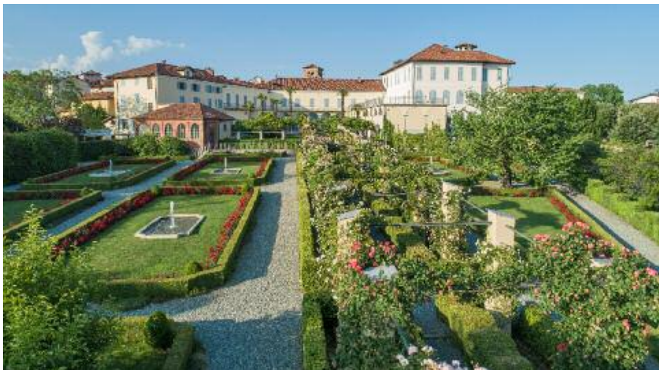
Palazzo Gromo Losa