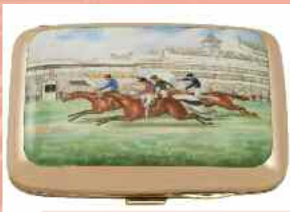
Di pregevole fattura questo portasigarette inglese, del periodo Eduardiano, datato 1902, in oro giallo e smalto. Valore, circa 10.500 euro