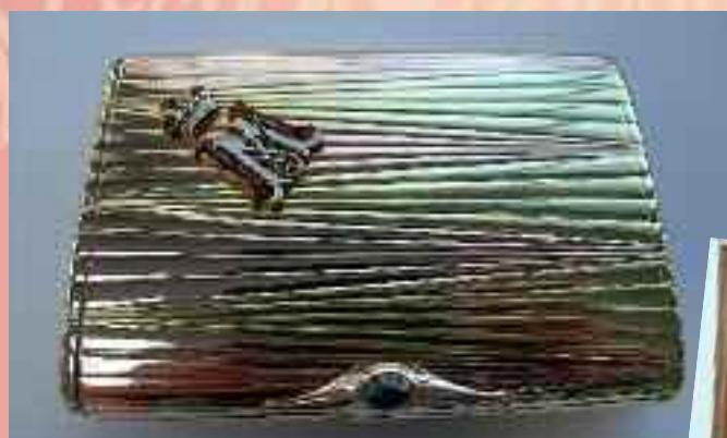
Il pezzo forte è un raro e importante portasisigarette antico russo del 1913 in oro giallo 14 carati e oro rosa. Reca il monogramma in smalto con Granduca Michaels MM applicato sulla parte superiore. E' appartenuto al nipote di Nicola I di Russia. Valutato più di 17.500 euro