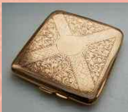
Portasigarette in oro a 9 carati, 109 grammi di peso, costa circa 3.300 euro