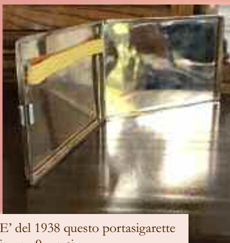
E' del 1938 questo portasigarette in oro 9 carati. Valore, 5.000 euro