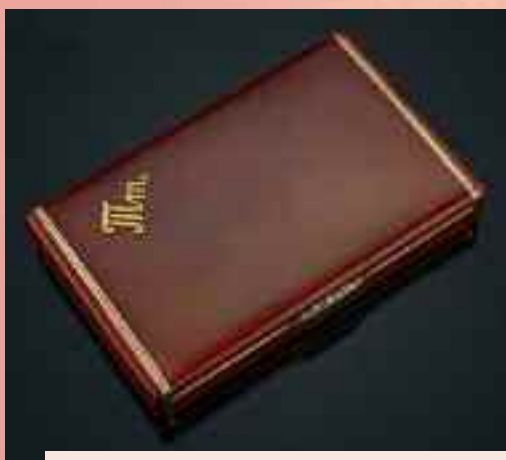
Questo è un portasigarette russo, risalente all'inizio del XX secolo. E' in argento, oro, smalto e impreziosito da diamanti. Valutazione, circa 8.000 euro.

Il portasigarette, ora oggetto desueto, non perde però di attrattiva come si può vedere navigando in alcuni siti di aste o di antiquariato specializzato. Vediamone alcuni 'esemplari'.